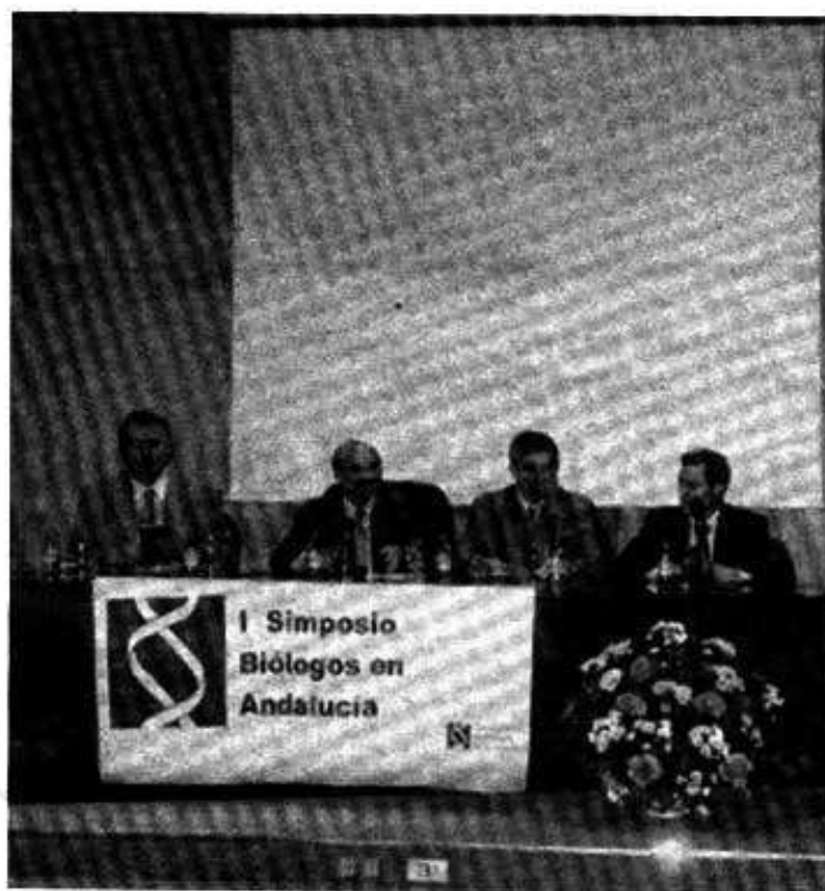
Imagen del I Simposio de Biólogos de Andalucía celebrado el año pasado en Sevilla.